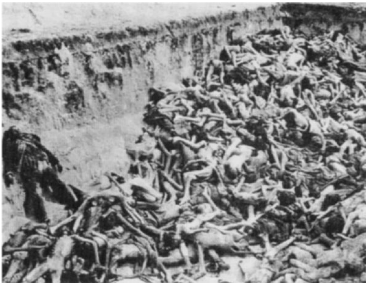
Fotografie masového hrobu obětí epidemie tyfu v táboře Bergen-Belsen, pořízená britskou armádou.

Vzhledem k absenci autentických fotografií dokumentujících masové vraždění se často stává, že jsou jako důkaz úmyslné masové vraždy prezentovány fotografie zemřelých v západních táborech na konci války z důvodu podvýživy a tyfu. Jistě, pekelné podmínky v západních táborech na konci války přesvědčily mnohé pozorovatele z řad spojenců, že zde skutečně došlo k masovému vraždění, jak dokládají prvotní zprávy. Ve skutečnosti tyto podmínky vyplynuly ze situace, za níž nebyla zodpovědná výhradně německá vláda. Himmler na konci války nelogicky nařídil evakuaci východních táborů před blížící se Rudou armádou, čímž došlo k zoufalému přeplnění západních táborů. Spojenecké bombardování zároveň zcela zničilo německou infrastrukturu, což znemožnilo zásobování táborů potravinami, léky a hygienickými prostředky. Nepochopení příčin masivního umírání pokračuje dodnes, zejména mezi Američany.